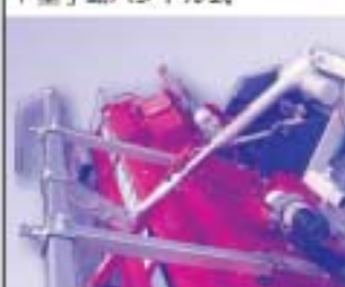
E型 電動ハンドル式 整地板の高さ調整のみ上下20cm