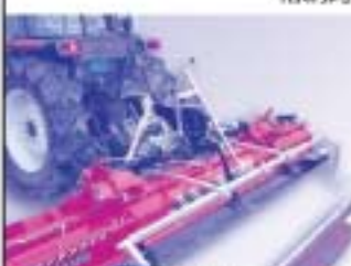
T型手動ハンドル式